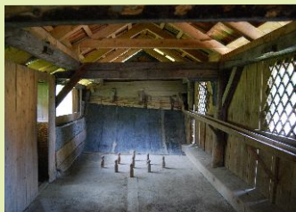
Kegeln beim Gasthof Gössler