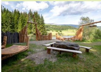
Keltendorf bei der Badeseerunde