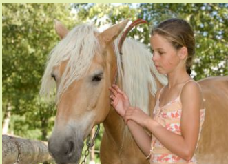
Reiten beim Tonnerhof