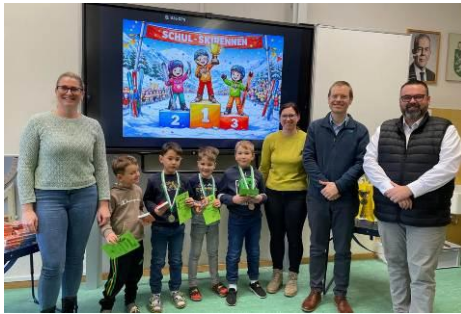
1. Klasse Buben