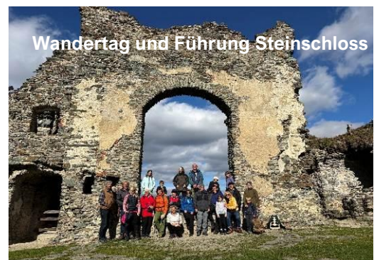
Wandertag und Führung Steinschloss