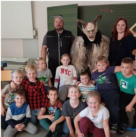
Aufregender Besuch der Mühlener Zirbenteufel bei uns in der Nachmittagsbetreuung

Unsere besonderen Highlights der letzten Monate :