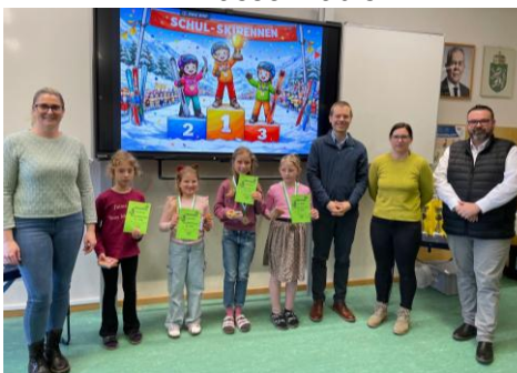
3. Klasse Mädls