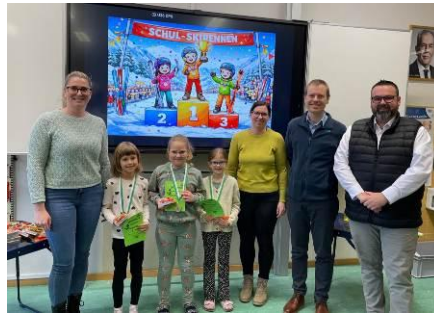
1. Klasse Mädls