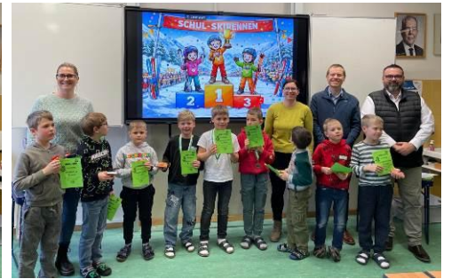
2. Klasse Buben