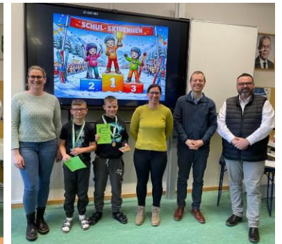
4. Klasse Buben