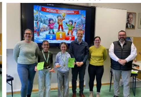
4. Klasse Mädls