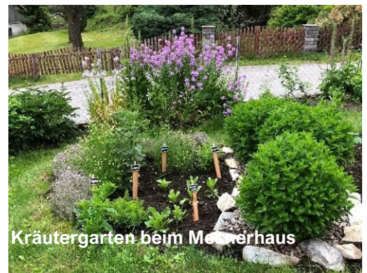
Kräutergarten beim Mesnerhaus

Der Verein Jakobsberger Dorfgemeinschaft steht damit beispielhaft für gelebten Zusammenhalt, freiwilliges Engagement und ein aktives Dorfleben, das Jung und Alt verbindet. Dafür sind wir dankbar.