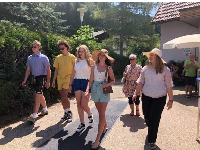
Unsere Models 2025 in Aktion

Dieses Jahr haben wir eine besondere Überraschung! Schnapp dir deine Freundinnen und Freunde und mach bei der Modenschau mit. Sucht euch dazu das Outfit im Tauschplatzl aus, präsentiert es auf dem Flohmarkt-Catwalk und gewinnt tolle Preise, denn das beste Outfit und die beste Performance werden prämiert! Details folgen 😊