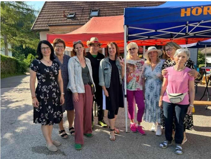
Das Tauschplatzl-Team am Flohmarkt 2025

Ein besonderes Highlight: am Sonntag, dem 12. Juli 2026 findet in Mühlen vor dem Tauschplatzl der dritte Flohmarkt statt und jeder Interessierte kann einen kostenlosen Standplatz aufbauen. Bitte vorher im Tauschplatzl anmelden. Für Getränke und Speisen sorgt das Team vom Tauschplatzl.