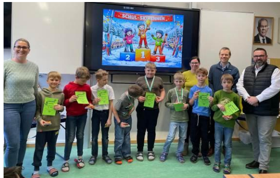
3. Klasse Buben