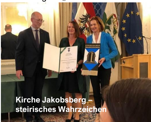
Kirche Jakobsberg – steirisches Wahrzeichen

Ein besonderer Moment war Auszeichnung der Filialkirche Jakobsberg als „Steirischen Wahrzeichen 2025“.