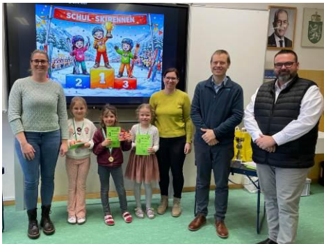
2. Klasse Mädls